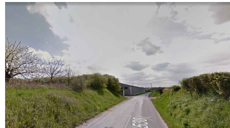
ANNEXE 3 - 2 - PHOTOGRAPHIE PROCHE